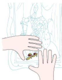
8. Le droit de ne regarder que les détails