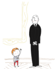
6. Le droit de poser des questions...