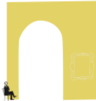
4. Le droit de s'asseoir..