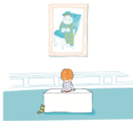
2. Le droit d'avoir une oeuvre préférée...