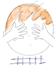
3. Le droit de fermer les yeux...