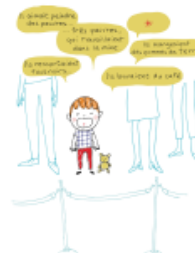
7. Le droit de partager ses impressions...