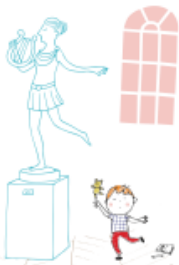
5. Le droit de copier...