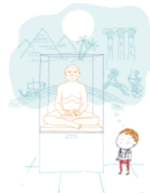
10. Le droit de t'évader du musée...