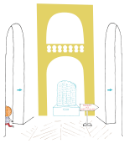
9. Le droit de ne pas tout regarder...