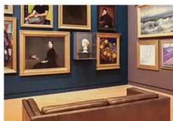
Concevoir des actions de médiation pour les personnes en situation de handicap