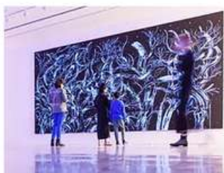
Concevoir des actions de médiation pour les familles