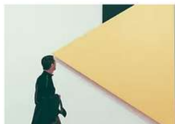
Concevoir des actions de médiation pour les adultes

Depuis 2017, la Lucarne propose des formations courtes, riches et interactives, spécialisées dans le domaine de la médiation culturelle :