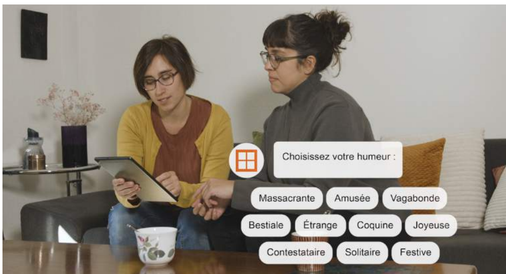
LES HUMEURS PROPOSÉES PAR ARTBOT

Afin de valoriser le Fonds cantonal d'art contemporain de Genève, nous avons développé Artbot, un robot conversationnel numérique qui guide le public dans la collection en ligne en fonction de leurs goûts et de leur envie. Ce feel good guide cultive l'empathie, l'humour et cherche à provoquer des émotions au fil d'expériences et de défis originaux. Il permet aux visiteurs de vivre une expérience personnalisée grâce aux arbres de décision et à l'intelligence artificielle.