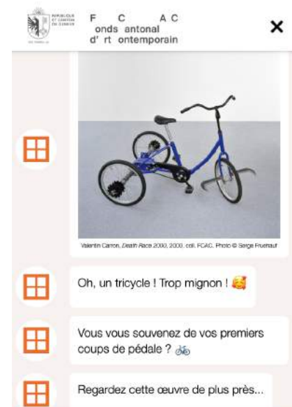
« JE SUIS D'HUMEUR MASSACRANTE »

Artbot permet de créer une médiation dynamique toujours disponible et interactive sur le site internet du FCAC. Loin d'être un chatbot classique qui donne des informations pratiques, il guide le visiteur en fonction de ses humeurs. Pour cela, nous avons sélectionné des œuvres en établissant une correspondance entre l'état d'esprit du visiteur et le travail d'un artiste. Cette entrée en matière permet de décomplexer la découverte de l'art contemporain. L'idée est avant tout d'offrir des impulsions aux utilisateurs, des portes d'entrée pour appréhender le fonds et mettre en lumière la démarche de plusieurs artistes. Ainsi, cette solution numérique valorise une sélection de la collection, permettant aux visiteurs d'entrer plus intimement en contact avec les œuvres, en dialoguant avec eux sous forme de courts messages.